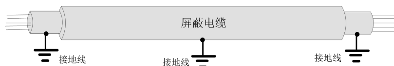
图 3 信号线接地示意图